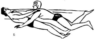
Транспортировка уставшего при плавании человека А - транспортировка на спине, Б - транспортировка впереди себя